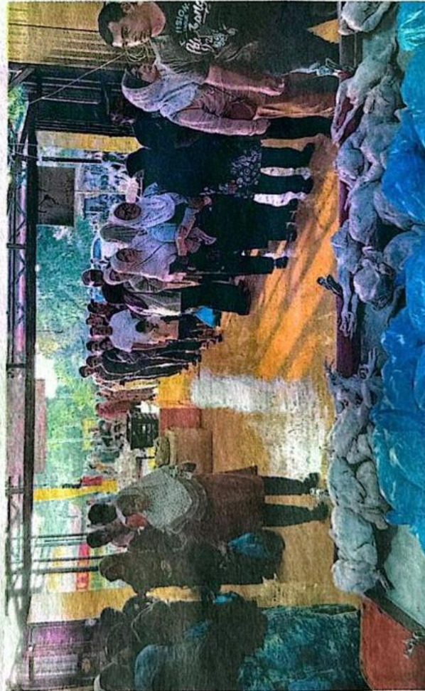
SEBAHAGIAN pengguna beratur untuk membeli ayam di Merbau Patah, Kuala Terengganu semalam.